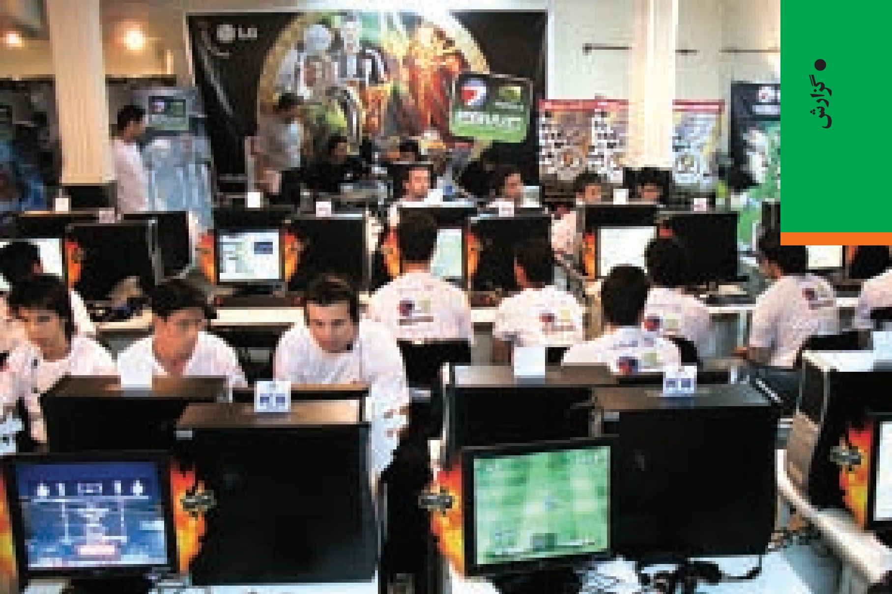
مسابقات سال گذشته در چنین حال و هوایی برگزار شد؛ جمع متعهدال شکل گیم با بازی خفن ایران

ثبت نام برای حضور در دور مقدماتی جام جهانی بازی‌های رایانه‌ای شروع شده، گیم‌بازها آستین‌ها را بالا بزنند