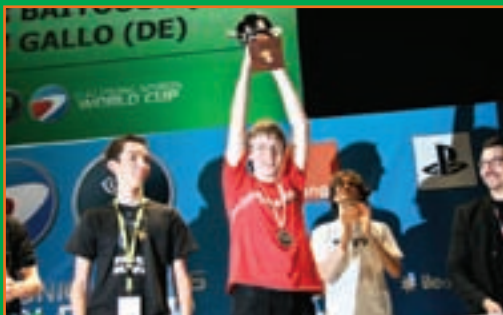
جام جهانی ۲۰۰۸ به جای فرانسه استثنائاً در آمریکا برگزار شد. این نوجوان های ۱۴ و ۱۵ ساله قهرمان بازی های رایانه ای شدند