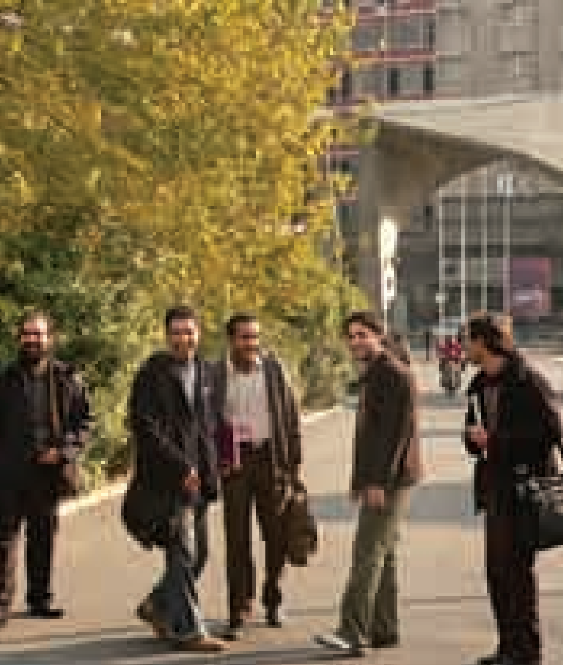
خیلی وقت است دانشجویان دانشگاه تهران دارند برای دانشجویان دیگر کری می خوانند

از معیارهای رتبه‌بندی دانشگاه‌ها خبر دارید؟ می‌دانید چرا دانشگاه شریف هنوز در بین ۵۰۰ دانشگاه برتر دنیاست؟